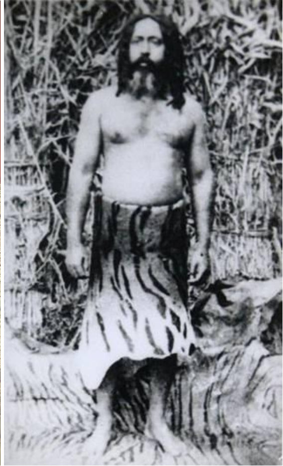
Venstre: En statue, der repræsenterer gudinden Kali, Kolkata. Højre: Soham Swami, en kendt Bengali guru og hinduistisk religiøs figure fra Inden.