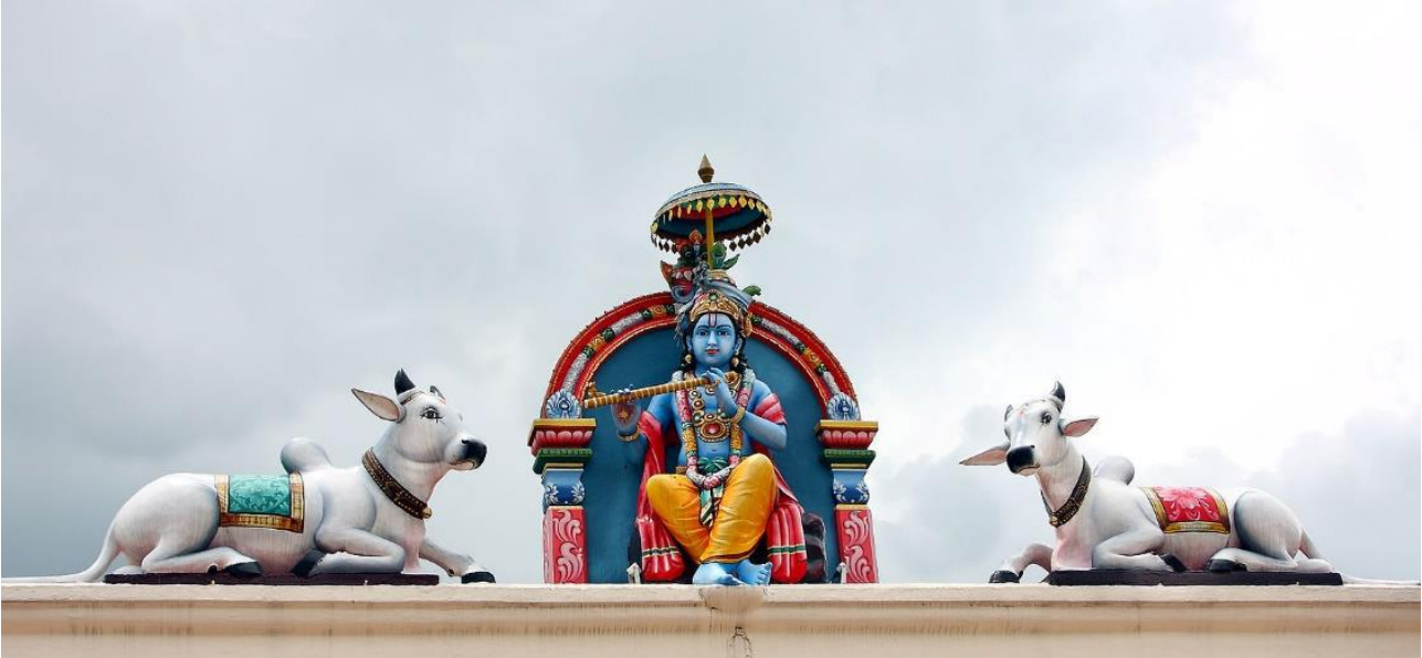
Krishnastatue (en manifestation af Vishnu) ved Sri Mariamman-templet (Singapore).