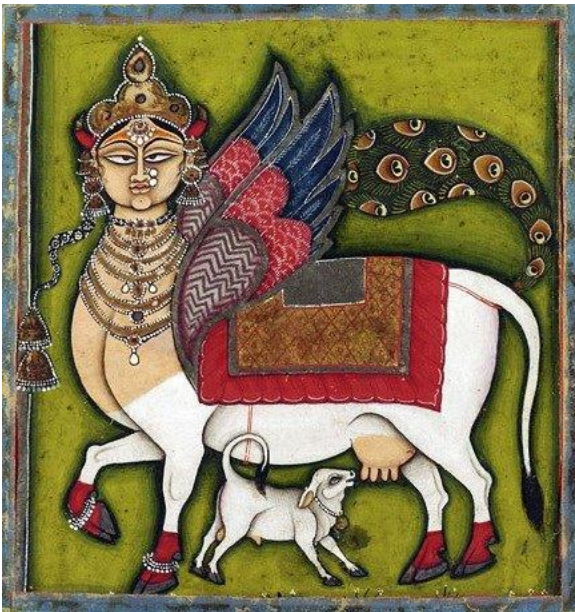
Kamadheni, den ønskeopfyldende ko, Rajasthan, India, Rajasthan, Jodhpur eller Nathadwa. Ca. 1825-1855.