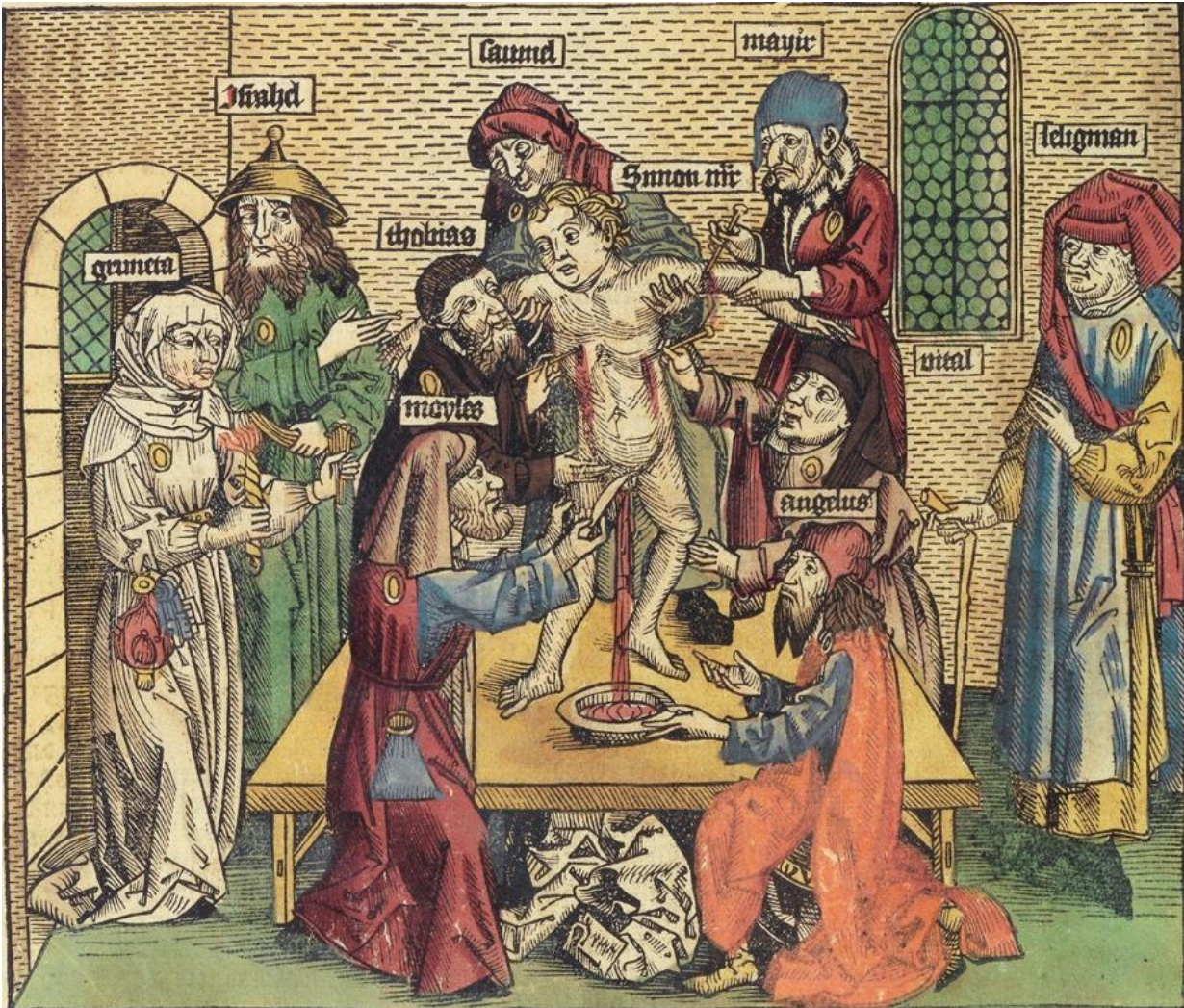
1. I Trent (1475) blev 15 jøder dømt til døden for mordet på Simon, der blev betragtet som en martyr af lokale kristne (kilde: Nürnberg World Chronicle )