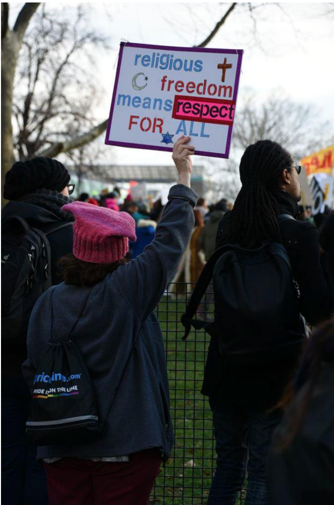
Battery Park rally mod præsident Donald Trumps kontroversielle immigrationsforbud.