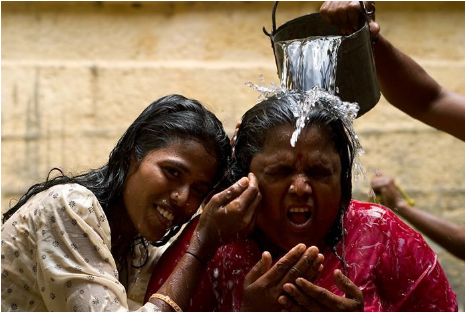
Hinduistisk ablusion i Alagarkoil, nær Madurai (Tamil Nadu, Indien).

Upanishaderne og hinduernes fælles verdensanskuelse