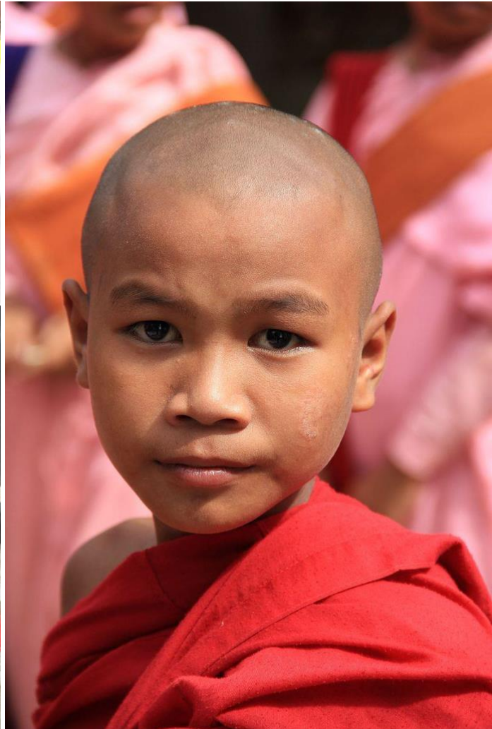
Venstre: Kronragning af en buddhistisk novice i Thailand. Højre: Buddhistisk munk i Myanmar