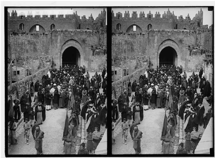
En muslimsk begravelse bevæger sig ind i den gamle by via Damaskusporten, Jerusalem, 1900 ca. Britisk mandatperiode eller tidligere.