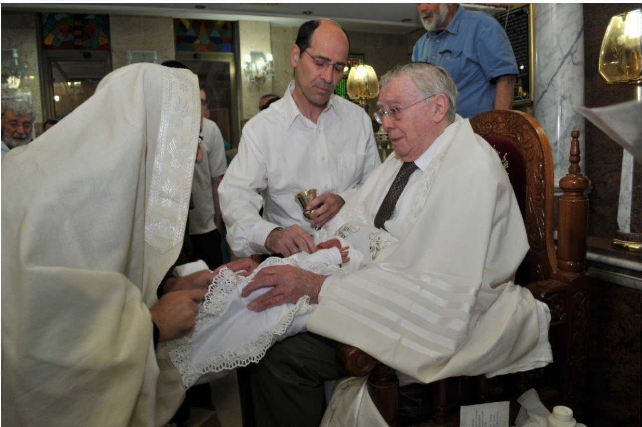
En brit milà ceremoni.