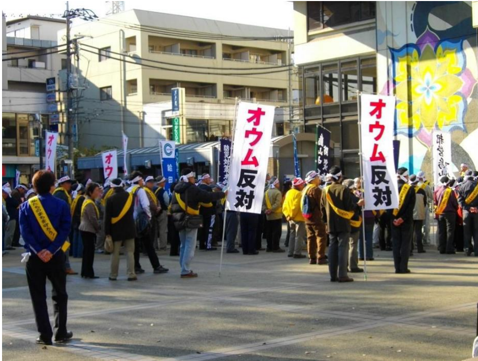
Anti-AumShinrikyō demonstrators in Japan.