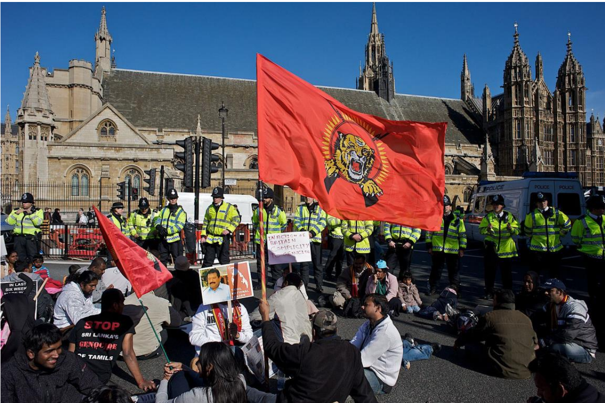
Protester mod Tamil i England.