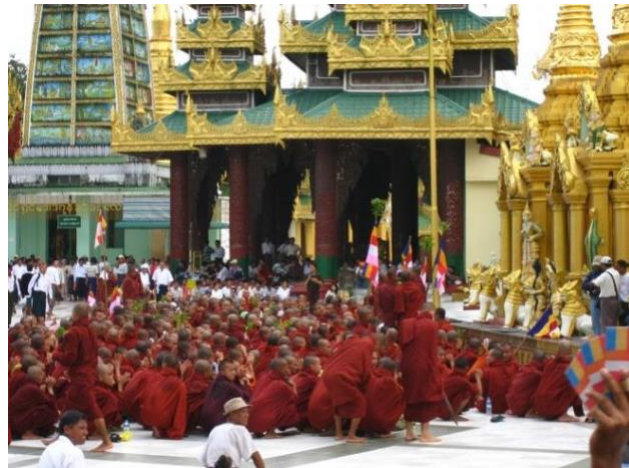
Venstre: Protester mod det burmesiske militærregime i 2007, Portland, Oregon. Højre: Munke protesterer i Burma, september 2007