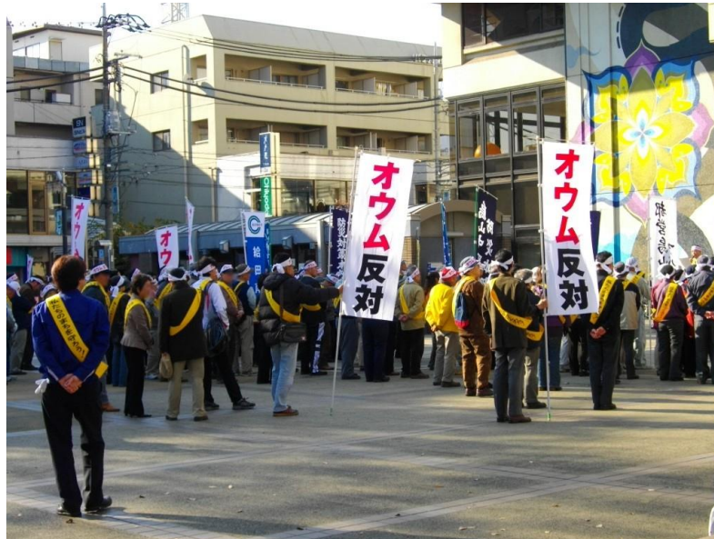
Dimostranti Anti-AumShinrikyō in Giappone.

mondo corrotto. Accettando in parte gli insegnamenti tantrici del buddhismo tibetano – per esempio, il rito poa , che consisteva nel guidare le anime del defunto in regni spirituali più elevati -, la missione fondamentale dell’Aum Shinrikyō era quella di potenziare la propria attività di salvezza al fine di trasformare spiritualmente il mondo. Per questo motivo, Asahara e i suoi discepoli non si considerarono mai dei criminali o degli assassini, bensì dei salvatori altamente formati nelle dottrine esoteriche, la cui missione era quella di debellare il karma cattivo e di guidare le anime degli uomini verso un regno spirituale migliore.