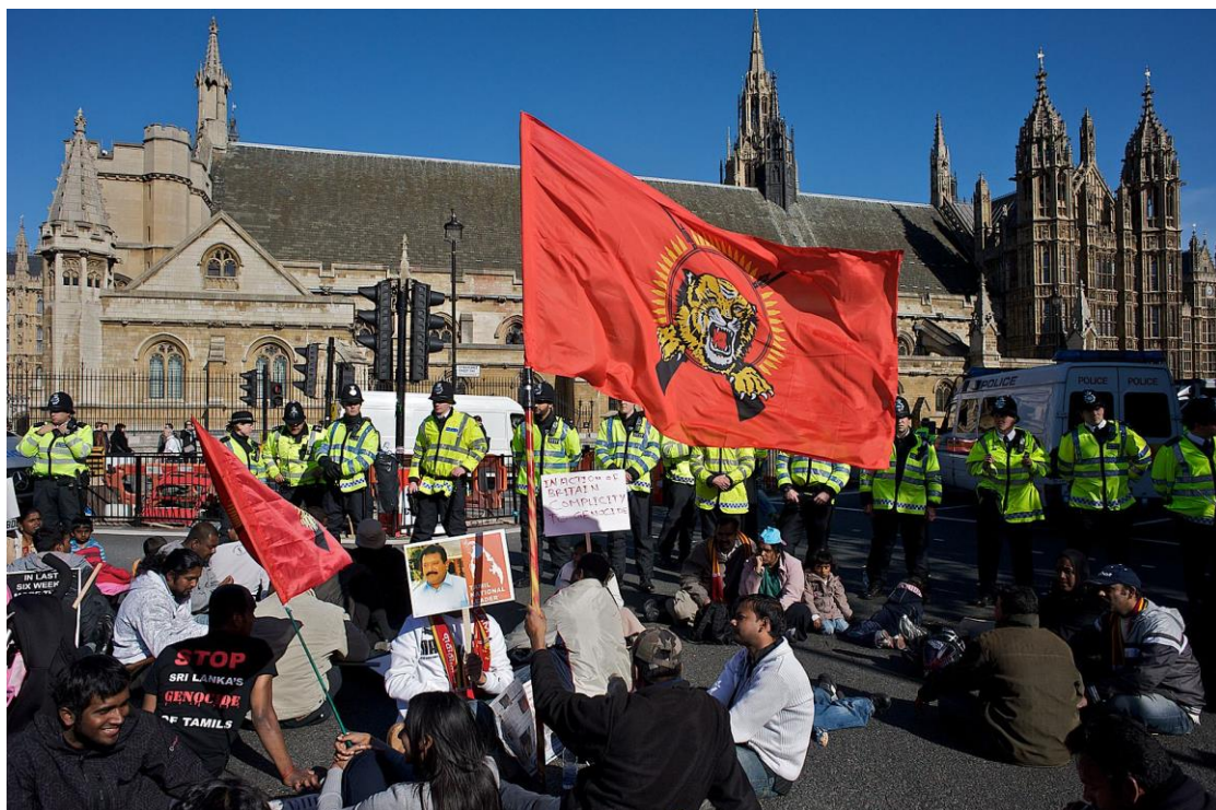
Protestanti Tamil in Inghilterra.