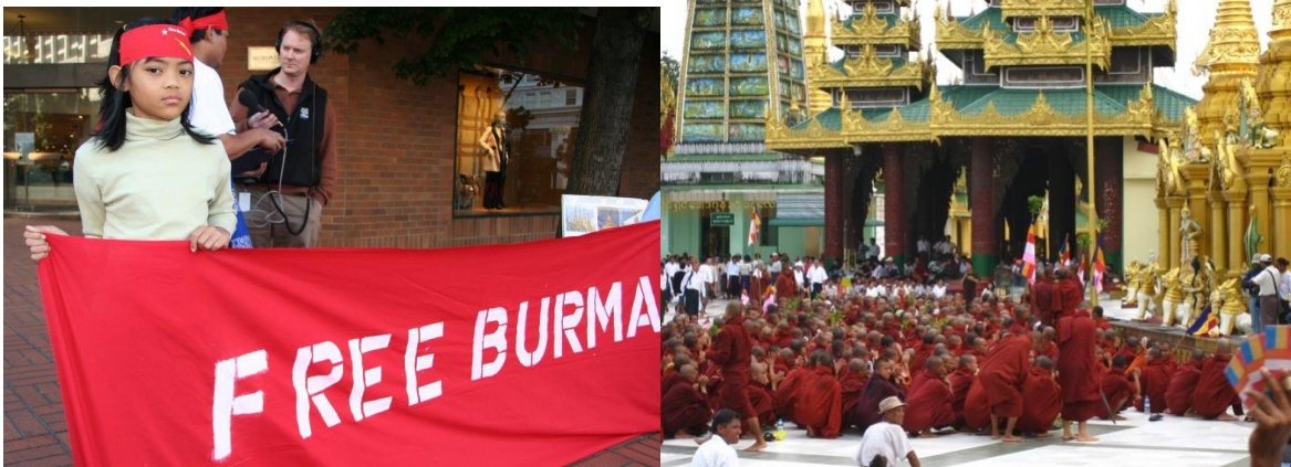
Sinistra: protesta contro il regime militare birmano nel 2007, Portland, Oregon. Autore: Jan Van Raay. Fonte: Wikicommons Destra: monaci protestano in Birmania, Settembre 2007