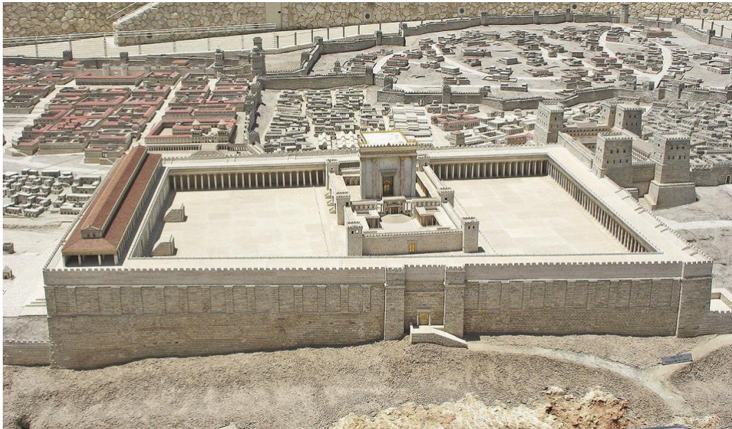
2. Un modelo del segundo templo (ver IERS módulo Judaísmo II, sección 2, fuente 2 )

Cumplir con la ley religiosa es una forma de adorar a Dios y mantener el Pacto. Dos de las prácticas más conocidas son el día de descanso ( Shabat ) y el kashrut , un complejo conjunto de leyes dietéticas . Algunos animales están prohibidos, y los que se consideran kosher deben ser sacrificados de cierta manera. La carne y la leche no se pueden mezclar. En tiempos antiguos, Dios era adorado en el Templo de Jerusalén . Desde la destrucción del Templo por los romanos, las sinagogas se han convertido en el centro de la vida religiosa judía.