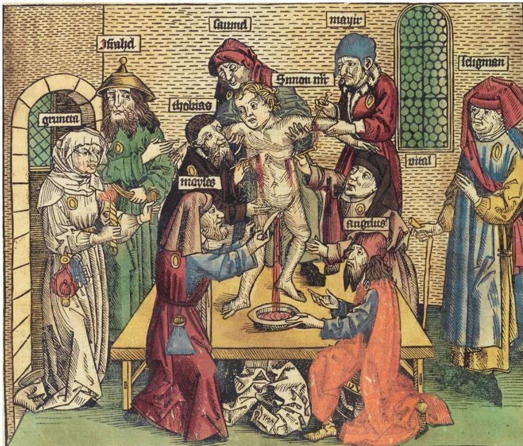
1. En 1475, en Trento, 15 judíos fueron condenados a muerte por el asesinato de Simón, considerado por los cristianos locales como un mártir (fuente: Nuremberg World Chronicle )