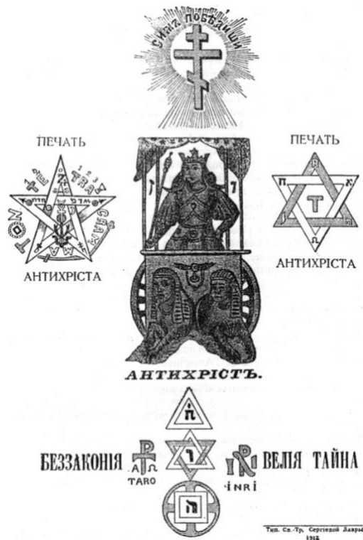
2. Una edición rusa de los Protocolos de los Sabios de Sión (1911)

Esta edición rusa de Los Protocolos de los Sabios de Sión usa símbolos ocultos para enfatizar el secreto de la trama.