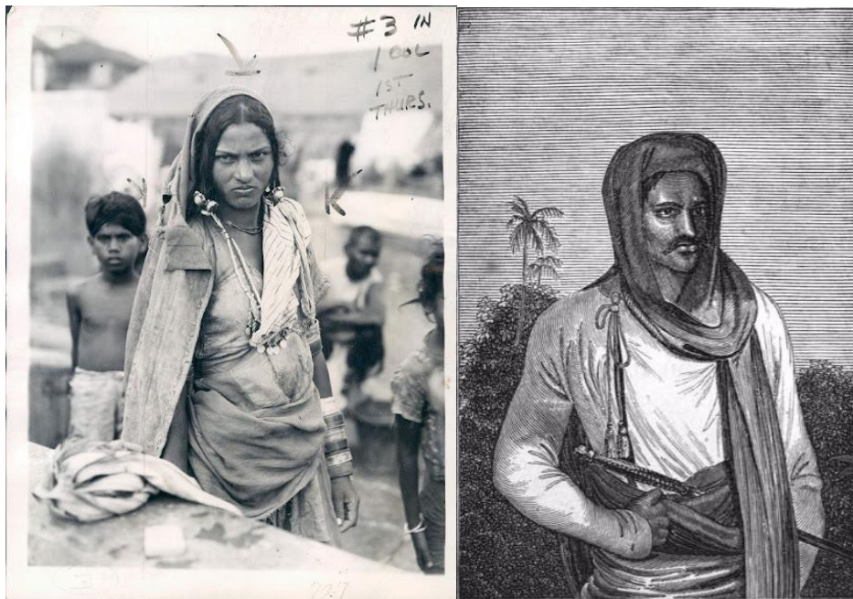
Izquierda: Dalit o mujer intocable de Bombay (Mumbai), 1942 ; derecha: retrato de un Kshatriya de Los Hindoos (1835).

concepto de orden sagrado y fuertemente connotado religiosamente, tiene su propia colocación, deberes y derechos bien predefinidos. Sin embargo, debe tenerse en cuenta que esta es una visión tradicional expresada por textos antiguos oficiales , mientras que la realidad actual de la India es mucho más complicada y modificada . El sistema actual no excluye ninguna movilidad social . Se debe tener en cuenta que cada varna se divide en múltiples jati (nacimiento), que es un término usado para denotar los miles de grupos sociales locales cerrados. Un jati puede moverse en el esquema jerárquico de la sociedad, y un individuo podría moverse a otro jati a través del matrimonio inter- jati . Además, la discriminación basada en la casta está prohibida en el artículo 15 de la Constitución de la India de 1950. Sin embargo, todavía es una costumbre común, especialmente en el matrimonio. De hecho, la idea de igualdad entre los seres humanos típica de la Ilustración es bastante antitética a la idea tradicional de la India.