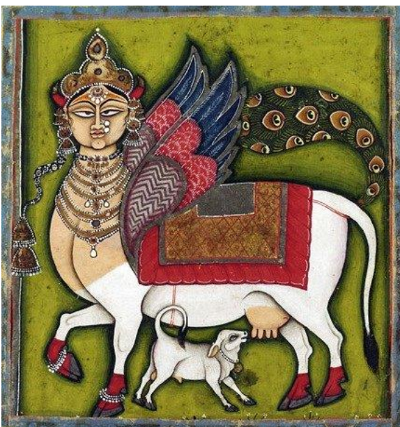
Kamadhenu, la vaca que concede deseos, Rajasthan, India, Rajasthan, Jodhpur o Nathdwara, 1825-55 ca