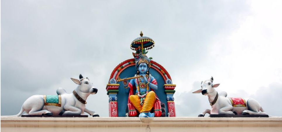
Krishna (una manifestación de Vishnu) Estatua en el Templo de Sri Mariamman (Singapur)