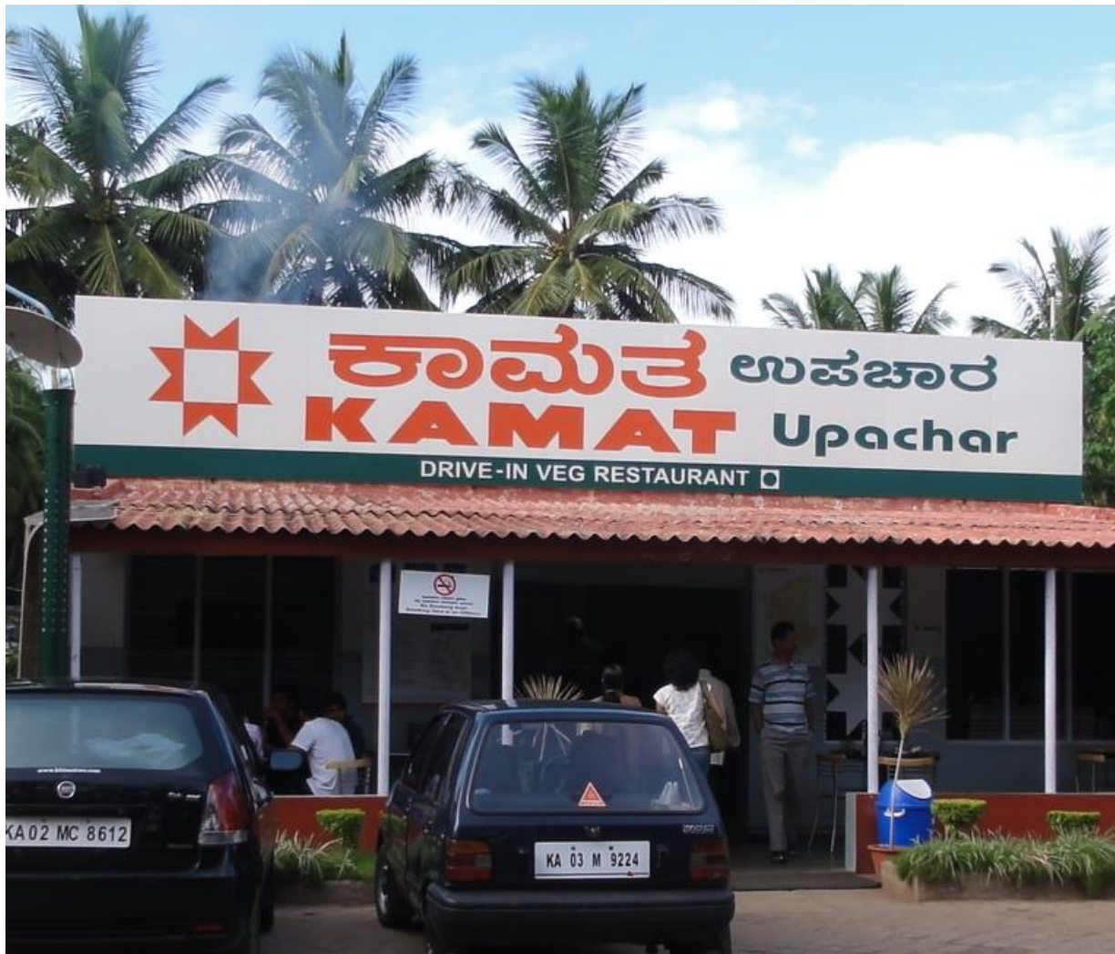
Restaurante vegetariano, Bangalore, Karnataka, India.