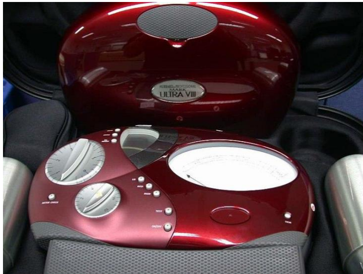
The “e-meter”device used by Scientology