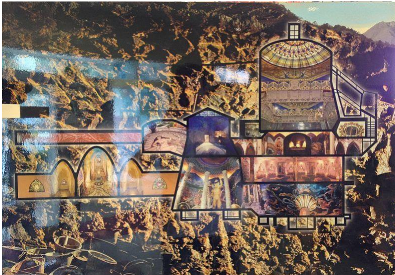
Diagrama que representa las salas subterráneas del templo Damanhur cerca del pueblo italiano de Baldissero Canavese.