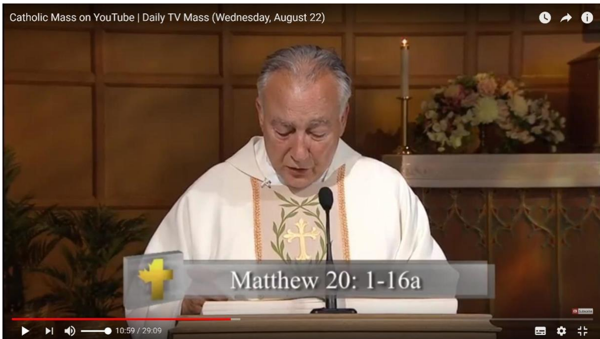
Una misa católica transmitida a través de YouTube. Aquí el sacerdote está leyendo un pasaje del Nuevo Testamento.