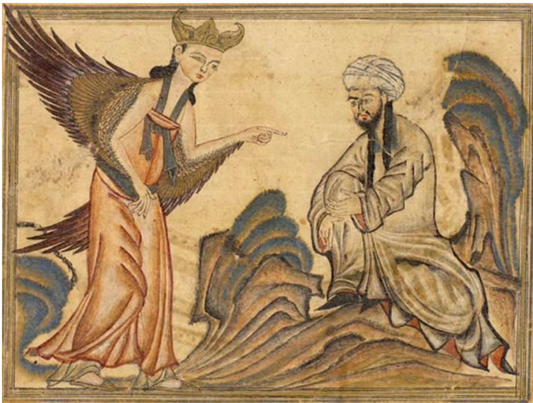
1. Muhammad reçoit la révélation de l'ange Gabriel. L'interdit islamique des images n'est pas aussi permanent qu'on le croit Voir. module IERS Islam II, section 9, source 2.

Pour les musulmans, Muhammad est le sceau des prophètes , c'est-à-dire le dernier prophète envoyé par Dieu. À l'âge de 40 ans, il commence à prêcher aux habitants de La Mecque de n'adorer qu'un seul Dieu. Muhammad et ses disciples ont été persécutés, c'est pourquoi ils émigrent vers Yathrib (connu par la suite sous le nom de Médine). Là, Muhammad organise une communauté politique et religieuse, la Umma . Après des années de guette, il s'empare de La Mecque et, à sa mort, il a unifié les tribus arabes en une seule entité politique.