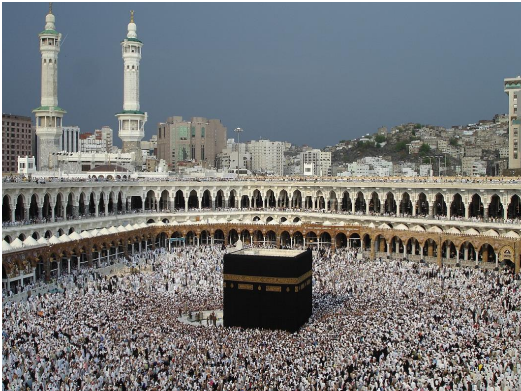
2. La Kaaba est le lieu le plus sacré de l'islam. Ce bâtiment est considéré comme la maison de Dieu. Chaque musulman doit prier dans sa direction. C'est des lieux que le musulman doit visiter lors du pèlerinage (crédits).

Il n'y a pas de credo unifié, mais quelques points sont communs à tous les musulmans. L'islam est un monothéisme strict , c'est-à-dire qu'il n'existe qu'un seul Dieu absolu et éternel, créateur de toute chose. La volonté divine est absolue, ce qui signifie que tout a été décidé par avance : la croyance en la prédestination est un élément important de l'islam. Les musulmans croient aussi que l'humanité sera jugée au jour de la résurrection , chacun selon ses actes. Dieu a envoyé des prophètes pour être ses messagers. Dieu ne s'adresse jamais directement à l'humanité (même aux prophètes), et il parle à travers les anges . Des livres saints ont été dictés par Dieu aux prophètes. Cependant, pour les musulmans, la Torah et les Évangiles ont été déformés, et seul le Coran est la parole littérale de Dieu , révélée à Muhammad par l'intermédiaire de l'ange Djibril (Gabriel).