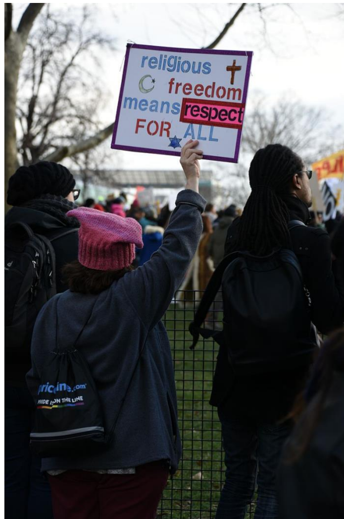
Battery Park Rassemblement contre l'interdiction controversée du président Donald Trump en matière d'immigration.