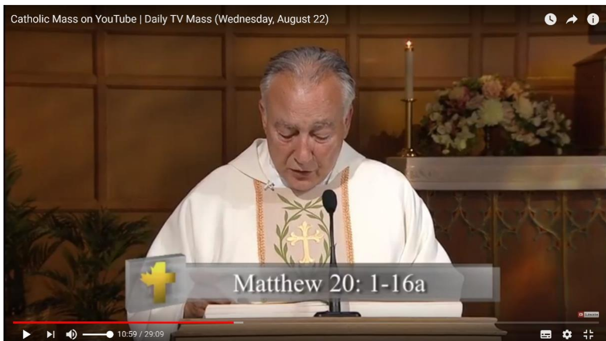
Une messe catholique diffusée sur YouTube. Ici, le prêtre lit un passage du Nouveau Testament.